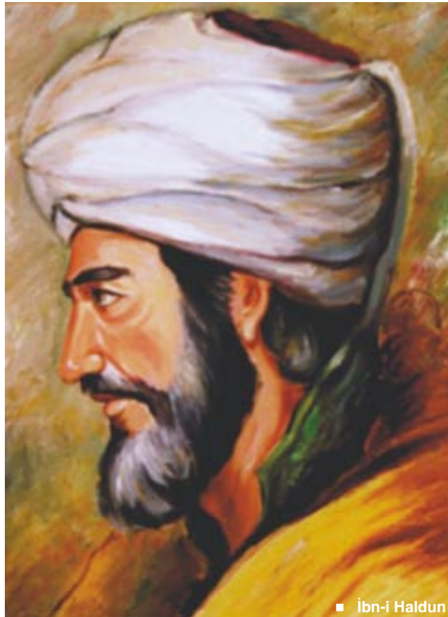
■ İbn-i Haldun

Ve bir de İslâmcılık, bir yandan en geniş mânâda bütün Müslümanları, daha dar kontekste ise Osmanlı tebaası Müslümanlarını bir tek millet telâkkî etmekle de, bir tür “milliyetçilik” öngörüyordu. Fakat tarihî gelişmeler başka mecrâda ilerlemeye başlamıştı. İşte İslâmcılık, bu ahvâl ve şerâit tahtında, bütün bu gelişmelere karşı bir kurtuluş reçetesi olarak ve baskın bir biçimde radikal bir “Batı-karşıtı” karakterle ortaya çıktı ve küçümsenmeyecek sonuçlar da aldı. Ancak, ne var ki, gelişmeler, Haldun’un, millî asabiyyenin dinî asabiyyeye göre öncelikli olduğunu ihtar eden tezini görmezlikten gelen İslâmcıların sukût-u hayâli ile noktalandığını ve “İttihâd-ı İslâm”ın sâdece bir fantezi olduğunu gösterdi. Bu konuda Said El Husrî ile Ziya Gökalp arasındaki tartışmalar bile başlı başına bir ders niteliğindedir. Netîcede, İslâmcılar, İmparatorluğun, yaşlı bir arslanın etrafını saran çakallar ve